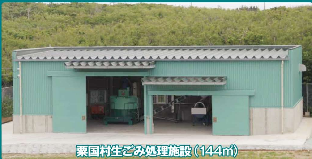
栗国村生ごみ処理施設 (144㎡)